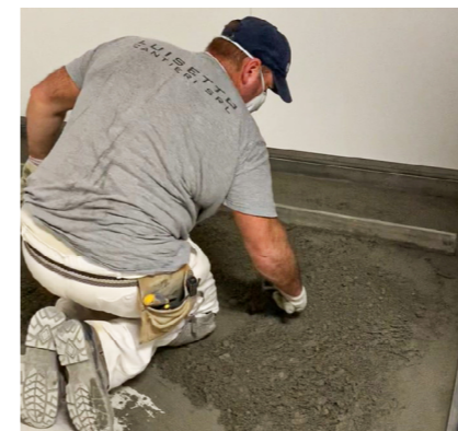
3- Stesura dell'impasto fresco su fresco e creazione delle pendenze