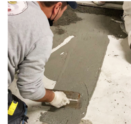
2- Applicazione dello Screed Primer come ponte di adesione con spatola dentata o rullo