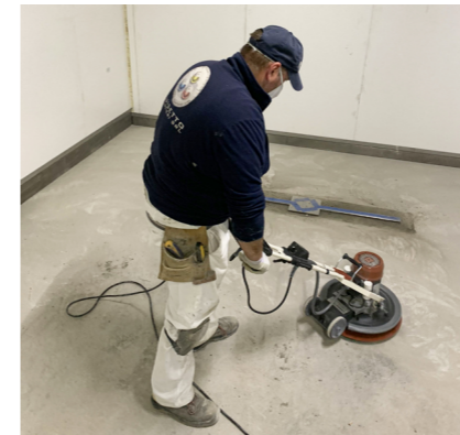
1- Preparazione del fondo. Rimozione della parte corticale o dello strato di resina presente.