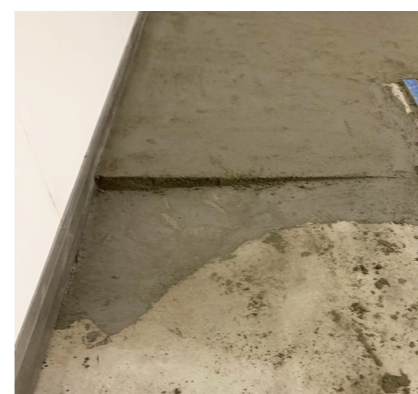
4- Dopo 24 ore è pronto per l'incollaggio del pavimento